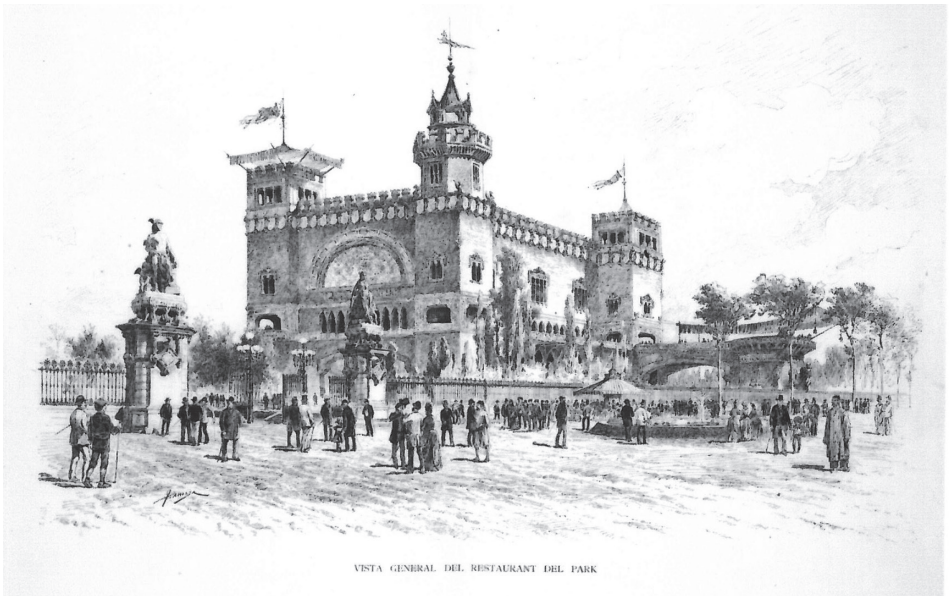
VISTA GENERAL DEL RESTAURANT DEL PARK

Dos exemples, per tant, que il·lustren com dues empreses de la Barcelona de finals del segle XIX apostaren per la medalla com a objecte de comunicació dels seus productes respectius, seguint dues propostes diferents en estil i edició.